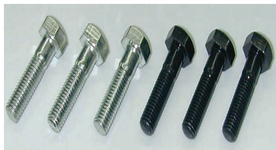
ノンクロム・白(左)とノンクロム・黒(右)